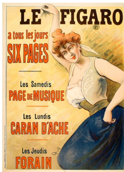
Jules Chéret, affiche pour Le Figaro (1895)