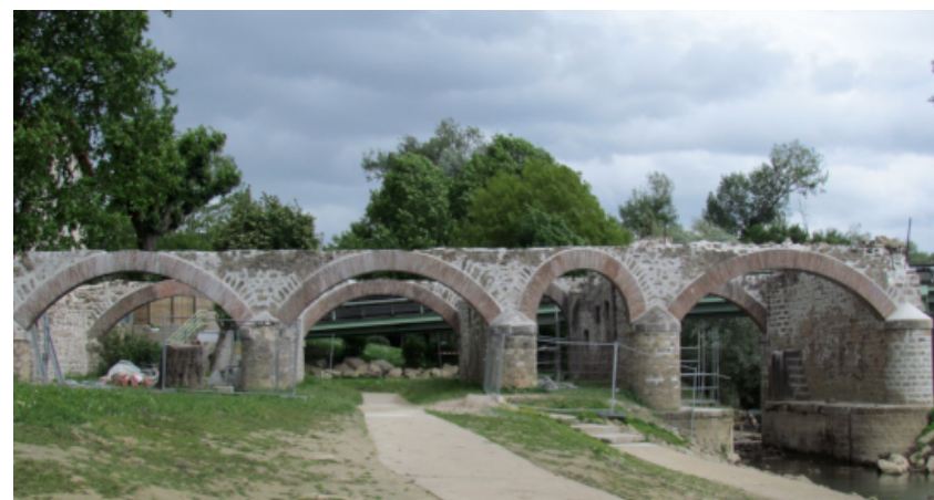
Le moulin aujourd'hui restauré par les services de Marne et Chantierne